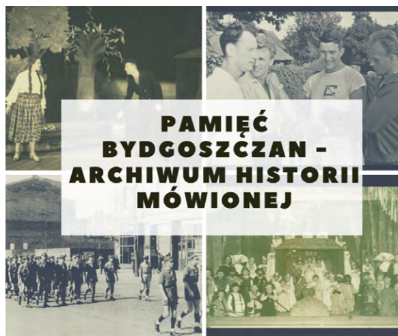
Paulina Gawrych, CC BY 4.0